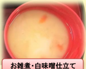
お雑煮・白味噌仕立て

お正月は毎年、元日に「白味噌仕立て」、二日は 「お餅・団子」です。お餅は粘り気がなく、歯が 「お餅・団子」です。お餅は粘り気がなく、歯が 「お餅・団子」です。お餅は粘り気がなく、歯が 「お餅・団子」です。お餅は粘り気がなく、歯が 「お餅・団子」です。お餅は粘り気がなく、歯が