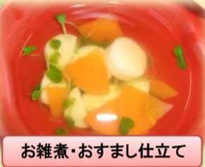
お雑煮・おすまし仕立て