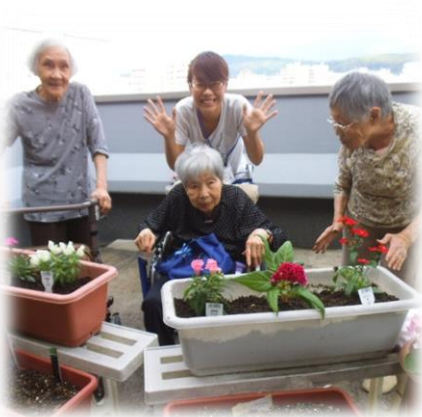
園芸活動も行なっています♪