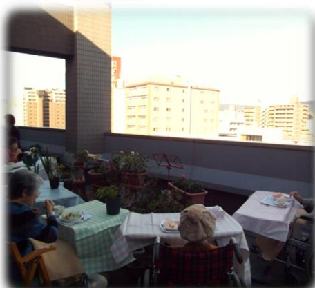
屋上でガーデンカフェを開催。青空の下、ゆったりと過ごして頂きました。