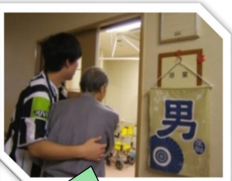
お一人ずつ、ご希望の時間に応じて入浴して頂きます。浴室は各フロアにあります。