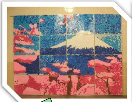
5階フロアの浴室には、ご利用者と職員で作成した貼り絵を浴槽の横に飾っています。