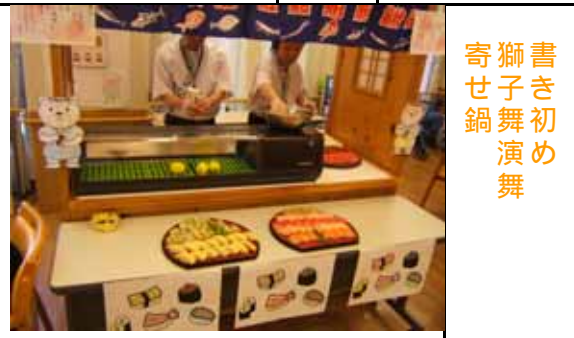
小学生慰問 ドライブ