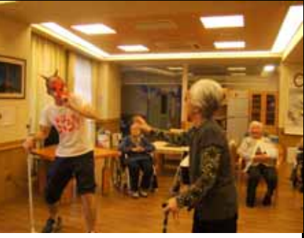
節分豆まき シチュー作り