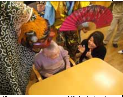
獅子舞初め 書き初め 寄せ鍋

入所フロア(3階)5階)では、毎月様々な行事を企画しています。裏面には各フロアの写真が掲載されています。